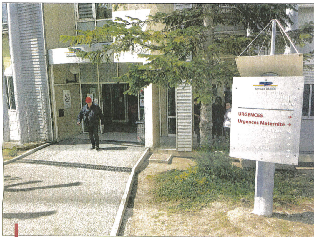
L'Agence régionale de santé propose une direction commune pour les hôpitaux d'Aubagne et de La Ciotat. Un projet qui ne fait pas l'unanimité.